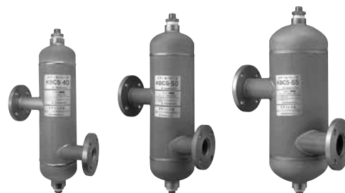
サイクロン形エアセパレータ